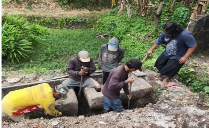
Sumber 9 Dokumentasi Observasi