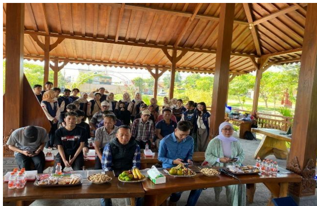
Sumber 6 Dokumentasi Observasi